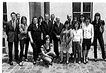
Lo staff di Andrea Scagliarini SpA al completo

Andrea Scagliarini SpA, dal 1976 punto di riferimento nel brokeraggio assicurativo italiano e specializzata nella gestione di programmi assicurativi aziendali, ha compiuto un importante passo nel proprio processo di crescita ed internazionalizzazione. L'azienda è infatti entrata a pieno titolo nel prestigioso network internazionale Worldwide Broker Network.